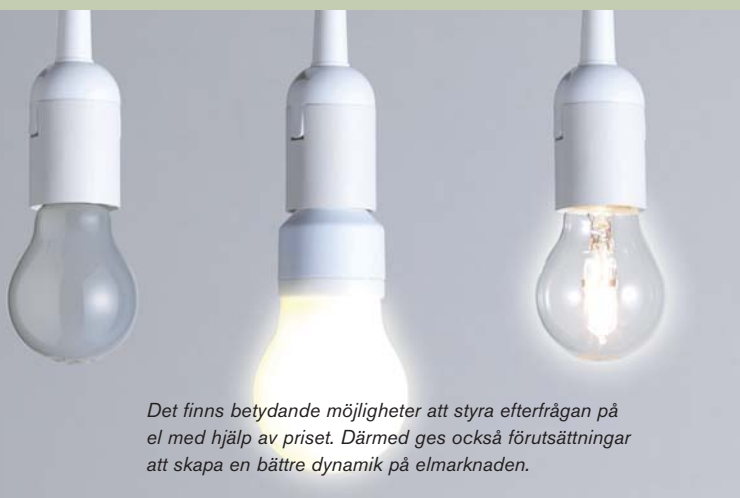
Det finns betydande möjligheter att styra efterfrågan på el med hjälp av priset. Därmed ges också förutsättningar att skapa en bättre dynamik på elmarknaden.

När det gäller de kunder som styrdes indirekt visade de sig som väntat vara mer aktiva än de som styrdes utifrån. De tog reda på när priserna var höga respektive låga och anpassade sin förbrukning därefter. Vanligaste åtgärden var att skjuta på användning av disk- och