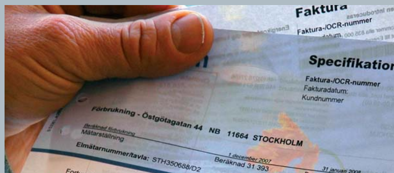
El konsumeras vanligtvis i lika stor mängd oavsett det underliggande priset.

På de flesta varumarknader finns annars en priskänslighet hos kunderna som medverkar till att begränsa efterfrågan när priset stiger. Många gör bedömningen att det vore önskvärt att det förhöll sig så även på elmarknaden, inte minst med tanke på hur dyrt det är att hålla reservkraftsanläggningar för bristsituationer som uppstår mycket sällan. Behovet av en ökad priskänslighet kommer troligtvis också att öka i samband med att en allt större andel av elförsörjningen baseras på vindkraft. Med mer vindkraft i systemet kommer elproduktionen att variera mera oförutsebart, eftersom tillgången på vind inte är konstant, vilket leder till större prisvariationer på elbörsen.